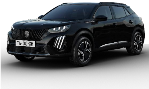
Perla Nera black