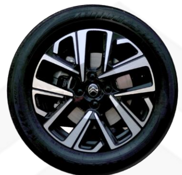
Versiones Plus y MAX Aleación diamantada bi-tons R17