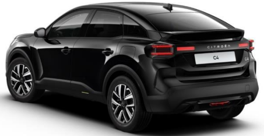
NEGRO PERLA NERA