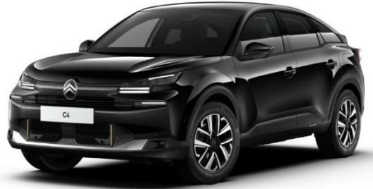
NEGRO PERLA NERA